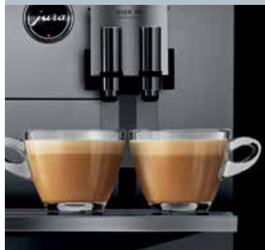
Reguleeritav topelttila kahe kohviava ja kahe piimaavaga