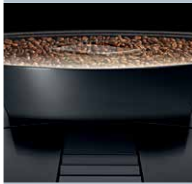
Professionaalne keraamiliste teradega veski