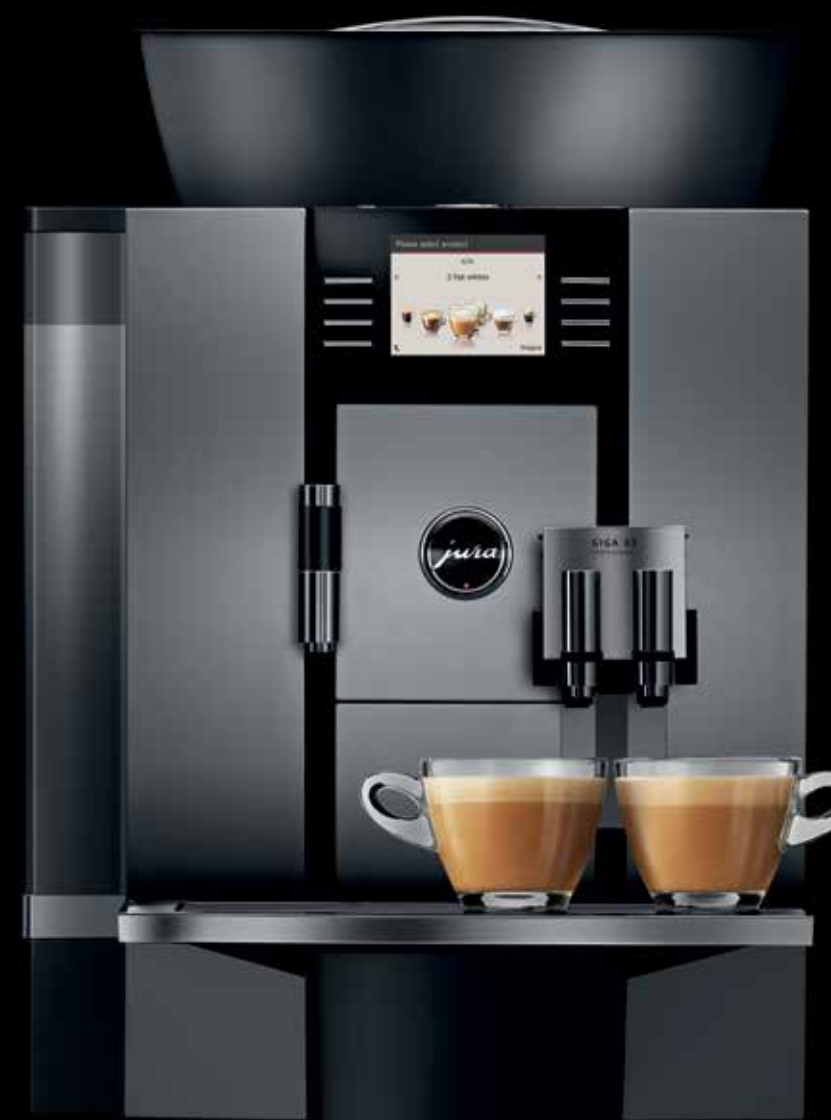
GIGA X3 Professional

Arvukad lisatarvikud, mille hulka kuuluvad nii tassisoojendi, piimajahuti, kohvipaksu eemaldamise komplekt, vedelikusahtli äravoolu komplekt ja arveldussüsteemi liides kui ka meeldiva välimusega hoiustamis- ja serverimisvahendid, aitavad luua täpselt Sinu nõudmistele vastava kohvivalmistuslahenduse.